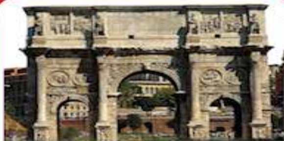
Arco de triunfo

Sirvieron para conmemorar o recordar algún acontecimiento importante