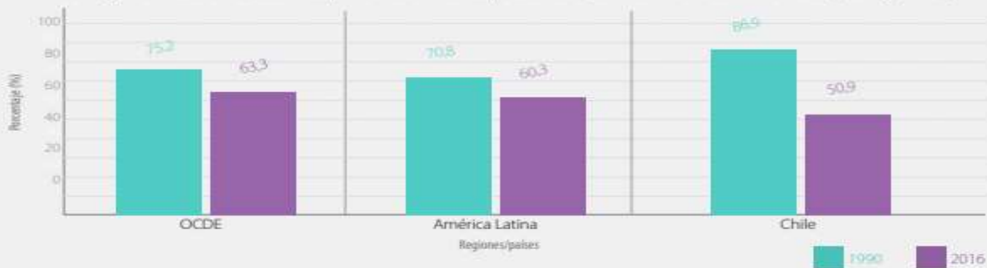
Porcentaje de votos en elecciones parlamentarias respecto de la población en edad de votar (1990 y 2016)

Extraído de Programa de las Naciones Unidas para el Desarrollo (2017), Diagnóstico sobre la Participación Electoral en Chile . Santiago: PNUD.