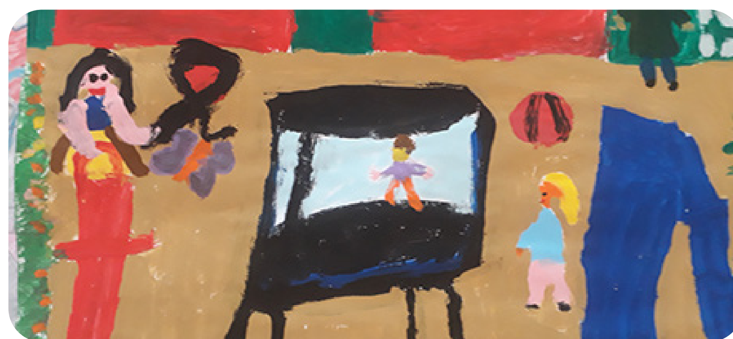
Trinidad Letelier, 5 años, Región Metropolitana.

A través del Plan de Gestión de Convivencia que orienta a la comunidad educativa en el desarrollo del buen trato, el respeto y la prevención del maltrato.