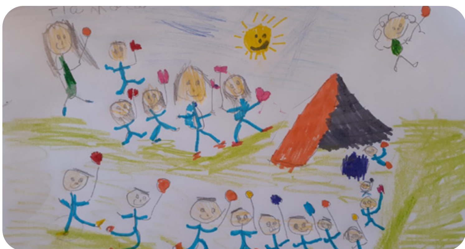
Emilia Del Río, 5 años, Región de Los Lagos.

Proveerles de atención, afecto, cuidado, protección, respeto y apego en su condición de sujetos de derechos.